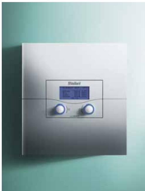
Vejrkompenseringen calorMATIC 630/3

Varmtvandsstyringen kan køres med valgfri parallel drift af centralvarme- og beholderladepumpe. Styringsprogrammet gør det muligt at indstille regelmæssig termisk desinfektion og garanterer herved en optimal varmtvandskvalitet.