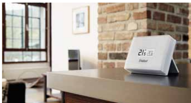
Online styring eRELAX